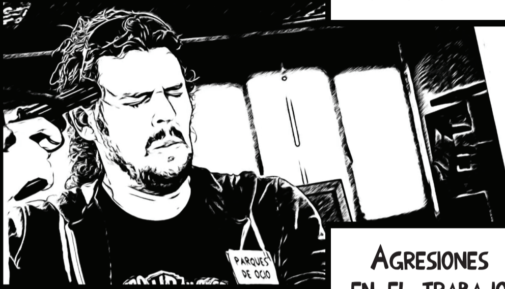
AGRESIONES EN EL TRABAJO